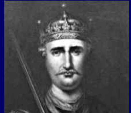
William the Conqueror

14 октября 1066 г. - битва при Гастингсе => Вильгельм объявил себя королем.